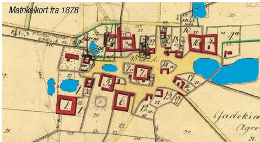
Matrikelkort over Ågerup fra 1878. Bemærk fællesjorden mellem gårdene, hvor dyrene løb frit rundt. Her ligger nutidens veje og stier. Gå på opdagelse på det gamle matrikelkort – hvor meget er der tilbage i dag?